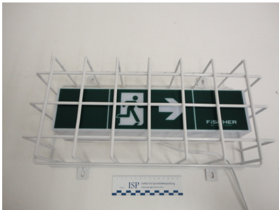
Abbildung 1: Frontansicht der Rettungszeichenleuchte mit dem Ballgeschuttkorb

Die Befestigung erfolgte kraftschlüssig an der Prüfwand.