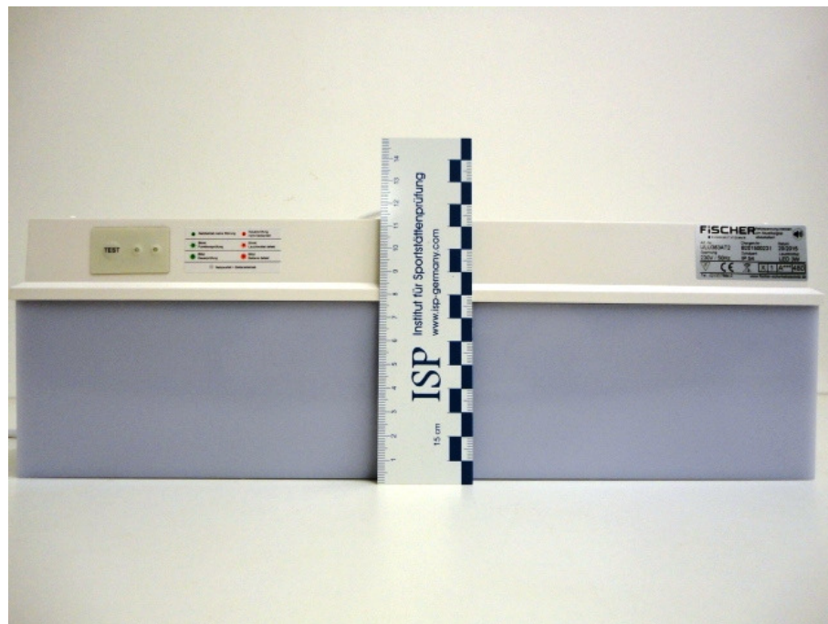
Abbildung 2: Ansicht der Rückseite der Rettungszeichenleuchte