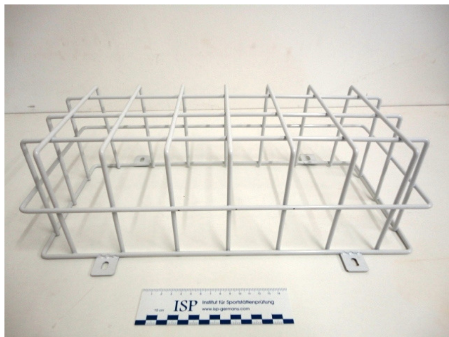
Abbildung 3: Ansicht des Ballschutzkorbes